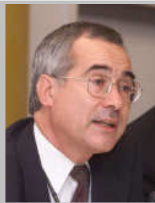
NICHOLAS STERN

himalayen entraînera de graves sécheresses dans la région. À cause du même phénomène de « polarisation des ressources hydriques », le rapport Stern prévoit des « changements considérables dans la disponibilité de l'eau » ( La « Stern Review » , Résumé (version longue), p. v). Le rapport cite d'ailleurs une étude affirmant que dans les années 2080, un milliard de personnes (dont une grande partie en Afrique) pourraient souffrir de pénurie d'eau. En contrepartie, certaines régions, comme le Canada, recevront une quantité accrue de précipitations pouvant entraîner des inondations. Le Canada, qui bénéficie de 25% des ressources en eau douce (ce pourcentage est appelé en théorie à augmenter), sera alors en position difficile. Quelle politique d'exportation de l'eau adoptera-t-il? À l'échelle mondiale, si la hausse des températures atteint 4°C ou plus, les risques sont importants que la fonte des glaces continentales du Groenland ou de l'Antarctique entraîne une hausse substantielle du niveau des océans